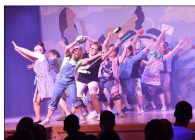
«Help» rufen mit Besen und Lappen die Turnerinnen der Damenriege, um dann als «Dancing Queens» zu feiern.