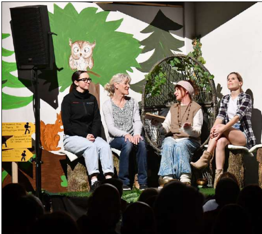
Die Theatergruppe Stetten sorgt für Lacher zwischen den Turnauftritten.