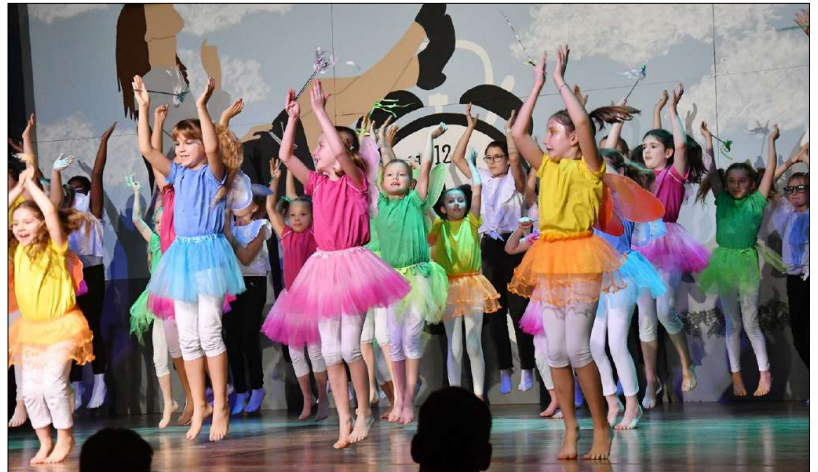
Die Mädchen der Mädchenriege hüpfen und tanzen als «gueti Feeä» über die Bühne.