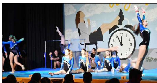
«Take a Break»: Die Turntalente des STV Stetten trainieren in der Gerätriege Art of Getu und zeigen ihr Können am Reck und auf dem Boden.