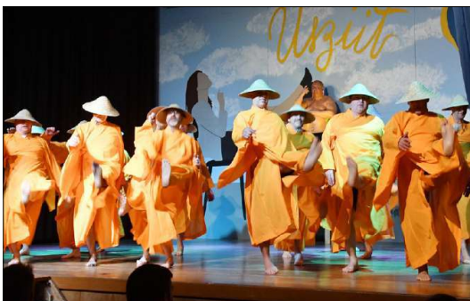
Die Männerriege nimmt eine Auszeit und meditiert «Sieben Jahre in Tibet».