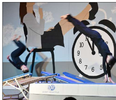
«Ab auf die Piste»: Jugendriege mit Sprüngen und Salti.